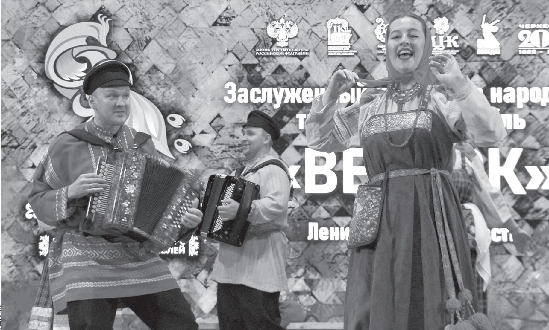
На фестивале «Традиции» выступает заслуженный коллектив народного творчества — ансамбль «Вереск» (Ленинградская область, город Выборг)

Дворец культуры Черкесска тщательно готовился к этому мероприятию. В фойе обнов-