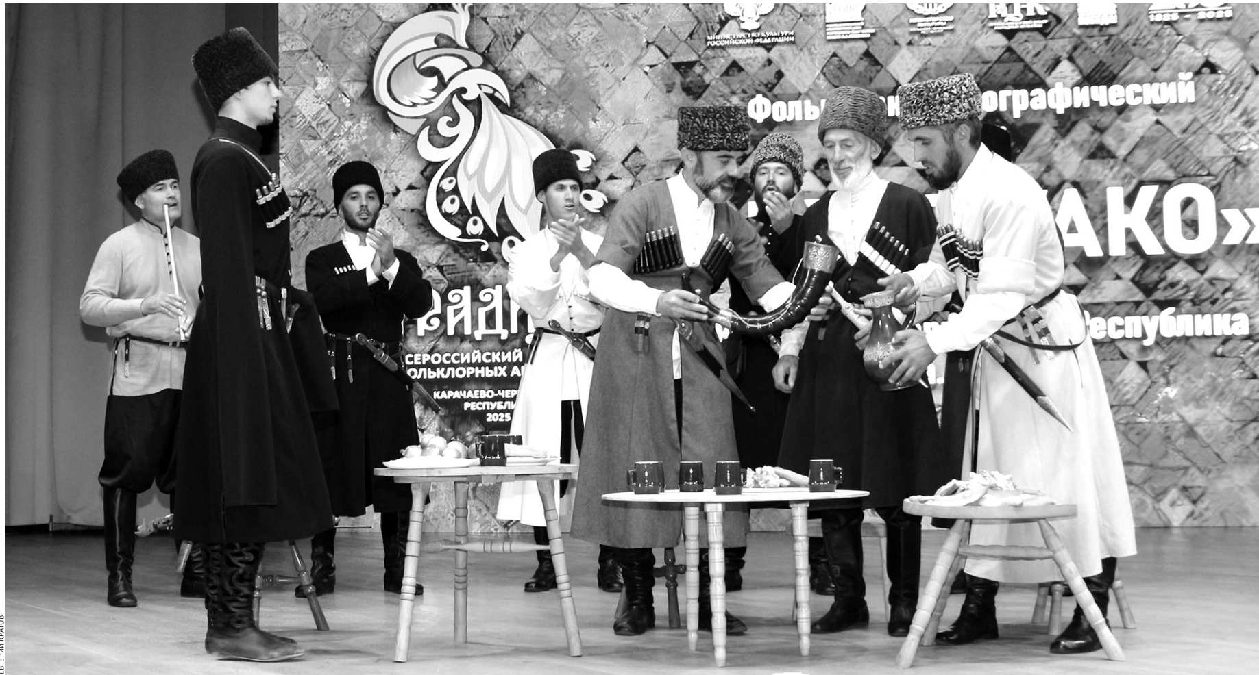
Выступление фольклорно-этнографического театра «Джегуако» (КЧР, а. Хабез)

Организаторами Всероссийского конкурса фольклорных ансамблей «Традиции» выступили Министерство культуры РФ, Российский Дом народного творчества имени В. Д. Поленова, Министерство культуры КЧР и Центр народной культуры КЧР.